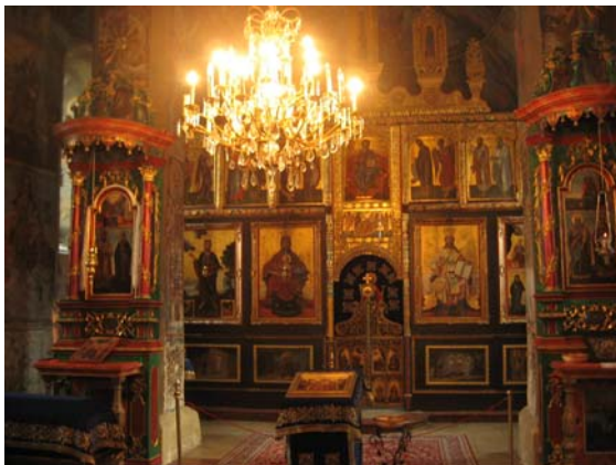
3. ábra: A templom ikonosztáza