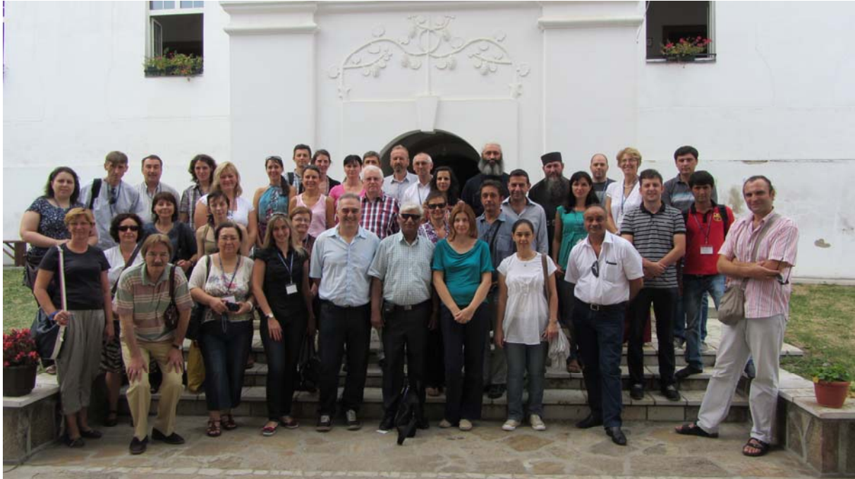
2. ábra: A workshop résztvevői a Krušedol kolostorban