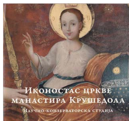
1. ábra: Krušedol kolostor-templom ikonosztáza: a tudományos konzerválásról készült tanulmány