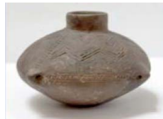
Szihalom (AM 2005/1)

Kőeszközök, kerámiák és fémek archeometriája 2011.12.13.