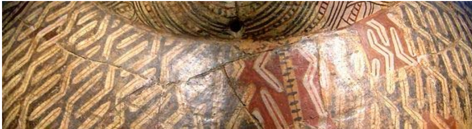
Kőszközők, kerámiák és fémek archeometriája 2011.12.13.