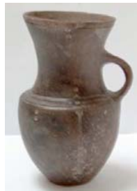
Zsitvató (AM 2005/1)