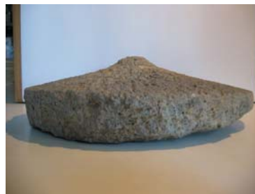
Római kori malomkövek, Zalalövő