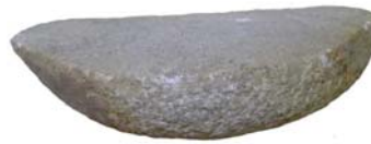
Késő rézkori őrlőkő Balatonlelle – Felső-Gamász