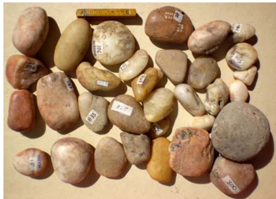
Kvarckavics - Gorzsa