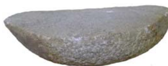
Késő rézkori őrlőkő Balatonlelle – Felső-Gamász