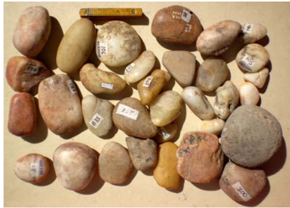
Kvarckavics - Gorzsa